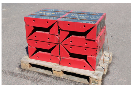
INNERHÖRN MX 60x50x20