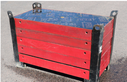
MAXIMO MX 120x60