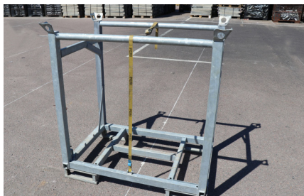
HÄCK RÄCKESNÄT PMB EP 110