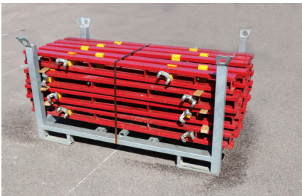
SKARVREGEL MAR 170/3