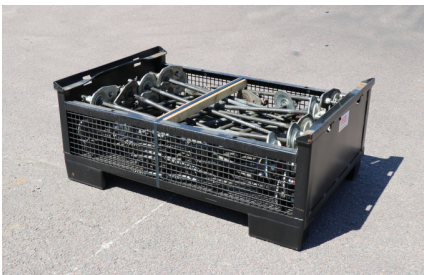
FORMSTAG MX 30-40