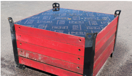
MAXIMO MX 120x120