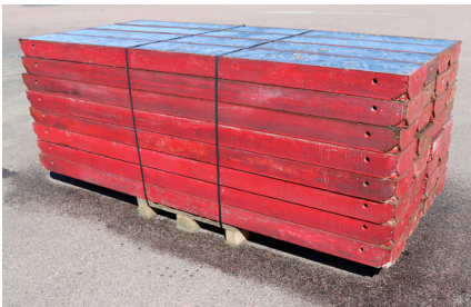
MAXIMO MX 270x30