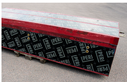
SCHAKTHÖRN MX 330