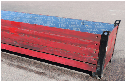
MAXIMO MX 330x90