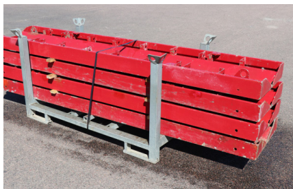
LÄNKHÖRN MX 270 INNER