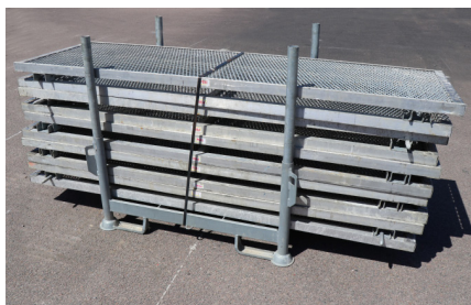
GJUTPLAN STÅL MXK 240