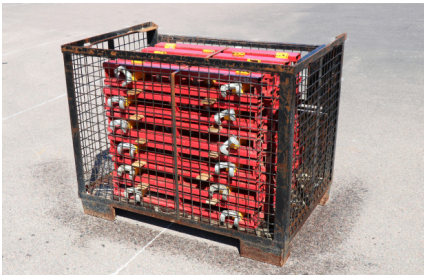
SKARVREGEL MAR 85/3