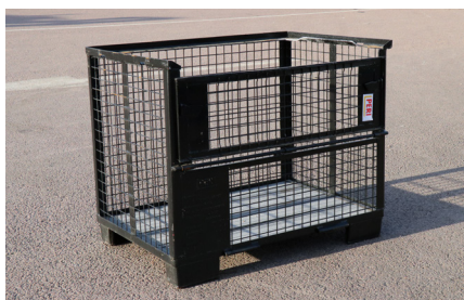
PERI GALLERKORG 80x120 SVART