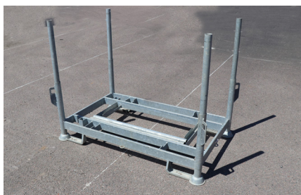
LASTHÄCK USP 104