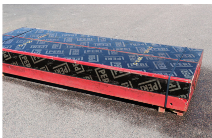
INNERHÖRN MX 270x50x20