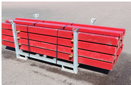
LÄNKHÖRN MX 270 YTTER