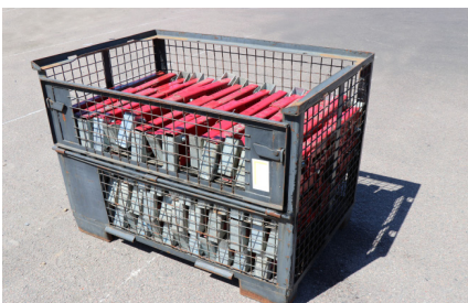
AVSTÅNDSHÅLLARE MX 15-40