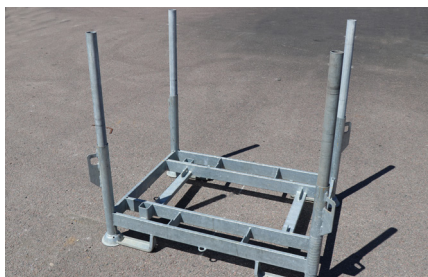
LASTHÄCK USP 72