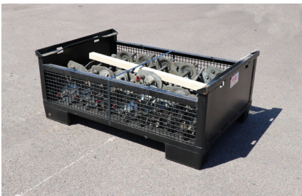
FORMSTAG MX 15-25