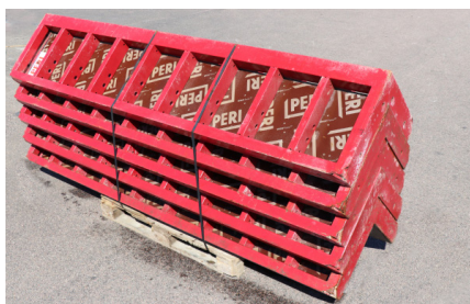
YTTERHÖRN MX 270x45