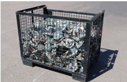
LÅSMUTTER MX 15