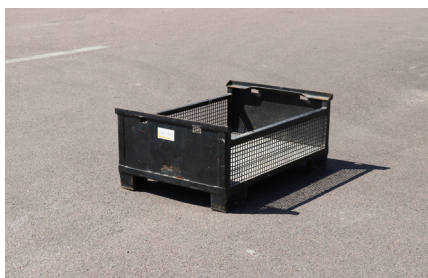
PERI GALLERKORG 80x120 LÅG